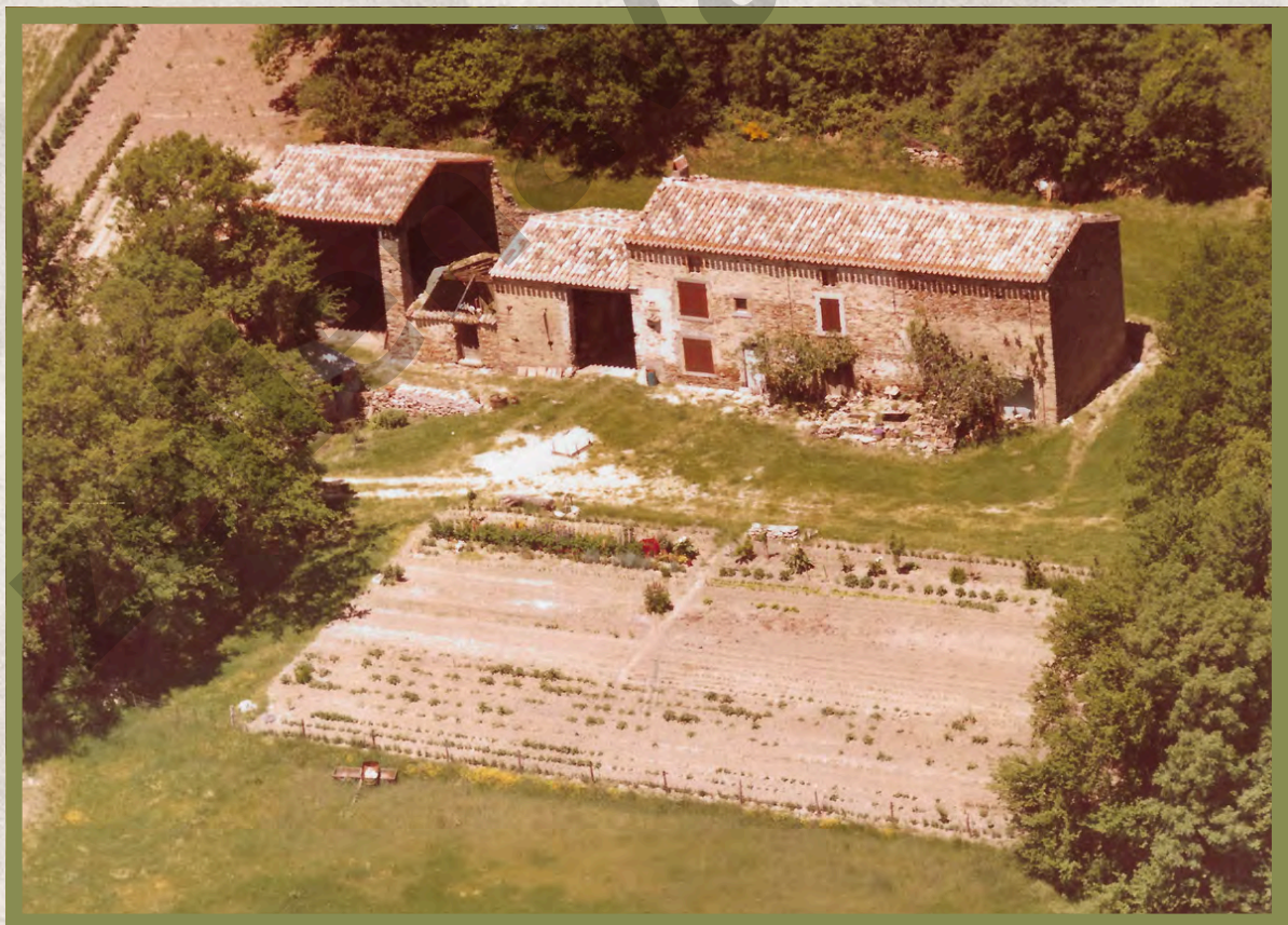
La Bâtisse vers 1975.

A la suite de ce bâti, la construction attenante, alors plus basse, apparaît plus massive. Les murs de pierre épais, la présence d'une ouverture unique relativement étroite (porte), avant les travaux de surélévation entrepris dans les années 1970, fait penser à une cave. A l'abri de la chaleur et de la lumière devaient être entreposés les tonneaux de vin de la récolte familiale annuelle.