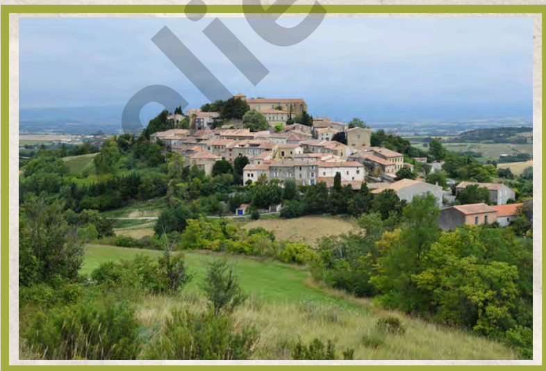
Laurac Le Grand

Le Pays de Lauragais doit son nom au castrum de Laurac-le-Grand.